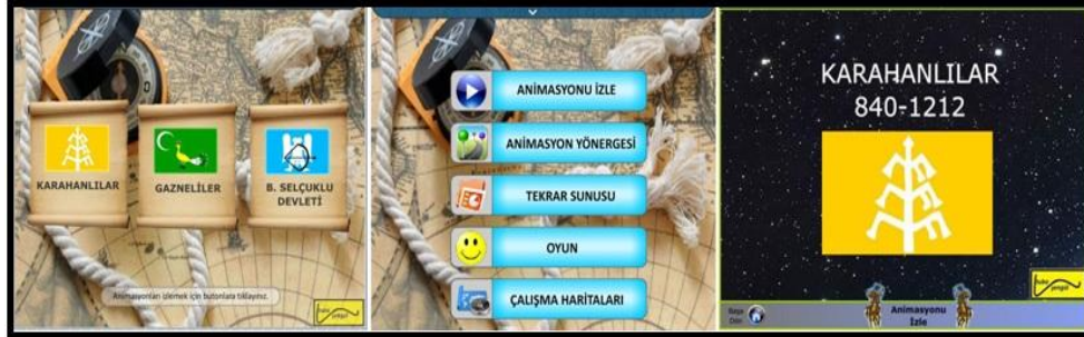
Resim 1.2. Arayüzden örnek görüntüler (Şengül Bircan 2013)

Çalışmada kullanılan animasyonlar, yönergeler ve öğrenme-öğretme etkinlikleri (tekrar sunusu-oyun-çalışma haritaları) materyal arayüzü içinde bölümlendirilmiştir. Materyal, üç bölümden oluşmuştur. Bunlar: Karahanlılar, Gazneliler ve Büyük Selçuklu Devleti'dir. Her bölümde; animasyon izle, animasyon yönergesi, tekrar sunusu, oyun ve çalışma haritaları yer almaktadır. Arayüzden örnekler Resim 1.2'de sunulmuştur.